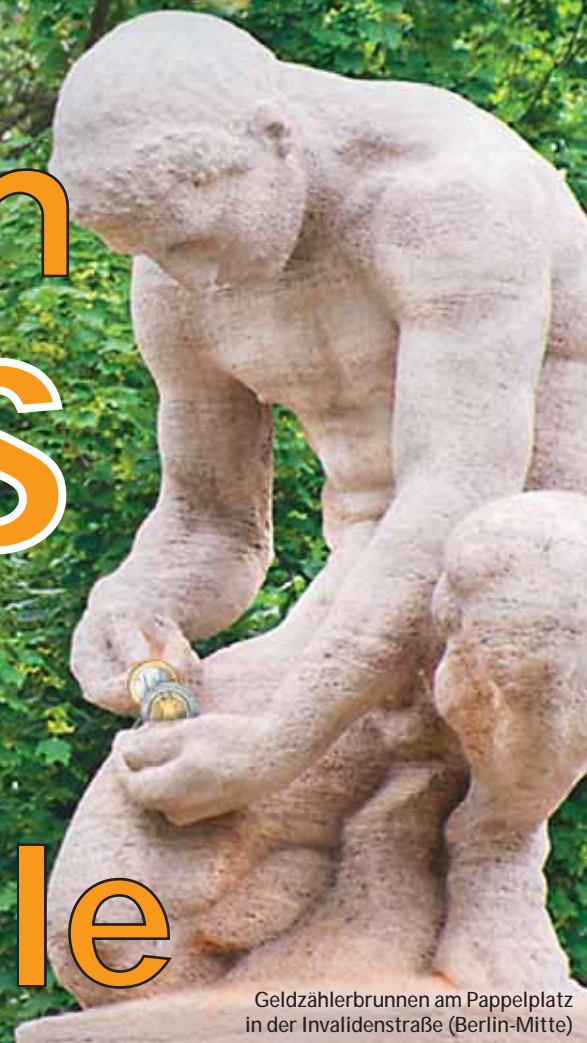
Geldzählerbrunnen am Pappelplatz in der Invalidenstraße (Berlin-Mitte)