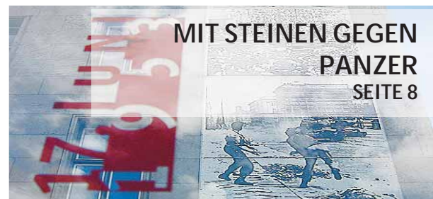
MIT STEINEN GEGEN PANZER SEITE 8