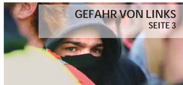
GEFAHR VON LINKS SEITE 3