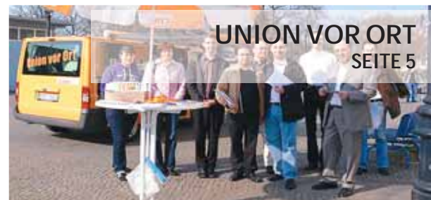
UNION VOR ORT SEITE 5