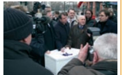
Starker Andrang zum Start des Bürgerbegehrens.

nach bekäme die Kochstraße eine Zweidrittel-Mehrheit. Eberhard Diepgen (CDU) und Dietrich Stobbe (SPD) sind gegen Dutschke. Stob-