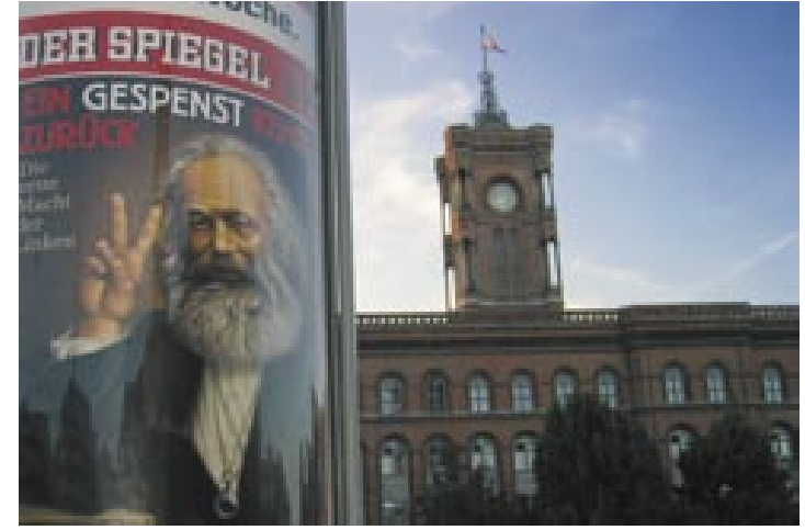
Ein rotes Gespensst im Roten Rathaus?

worten und damit die Stadt an den Rand der finanziellen Handlungsunfähigkeit manövriert. Hier von einem Jahr zu sprechen, auf das man stolz sein könne, wertete Schmitt als befremdlich. „Wir müssen