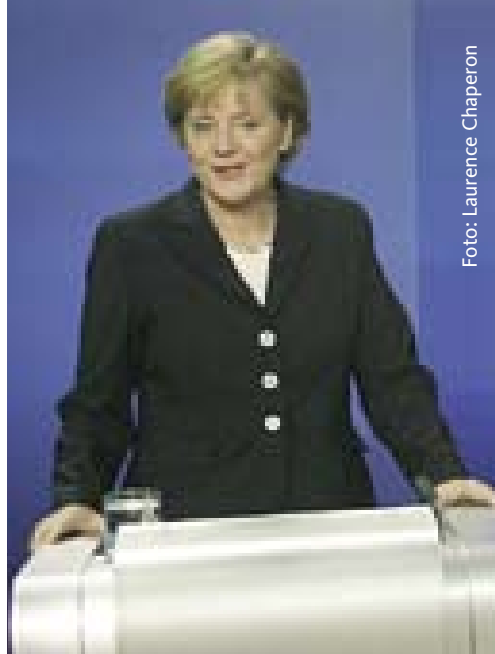
Angela Merkel beim TV-Duell

„Angela Merkel war dem Amtsinhaber sachlich voraus, hat einen realistischeren Zugang zu den ent-