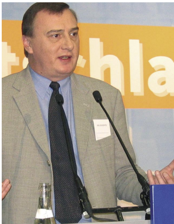
CDU-Landesvorsitzender Ingo Schmitt

fen. Ingo Schmitt: „Neben der Arbeitsmarkt- und Wirtschafts- sowie Bildungs- und Sicherheitspolitik wird die Berliner CDU verstärkt Schwerpunkte in der Familien- und Sozialpolitik setzen, um wieder mehr als eine Partei für die Bürgerinnen und Bürger wahrgenommen zu werden.“ Erste Papiere wurden dazu auf der Klausurfahrt diskutiert. Eine vom Landesvorstand eingesetzte Strategiekommision soll nun diesen Prozess in Abstimmung mit den einzelnen Parteigliederungen vorbereiten und die Grundlagen für ein Programm für die Abgeordnetenhauswahlen 2006 legen.