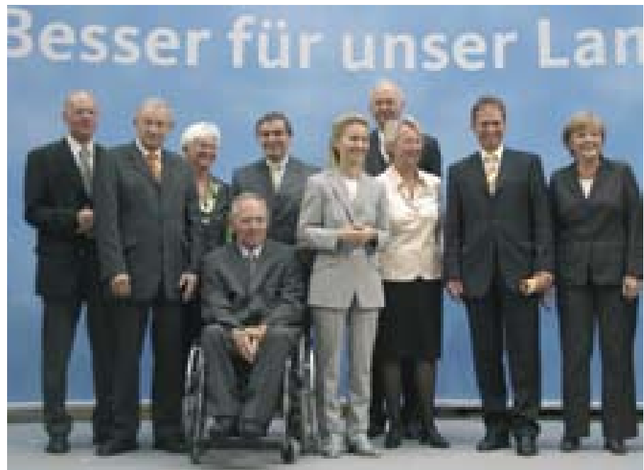
Das Kompetenz-Team bei der Vorstellung im Konrad-Adenauer-Haus.

sten Wochen für die Anliegen der Union eintreten“ würden. „Wir sind eine starke Truppe und wir werden zeigen, dass wir es besser können“, sagte Merkel. Dem Tagespiegel gefällt die Typenbezeichnung nicht, er stellt aber fest: „... wer ihr „Kompetenzteam“ unvoreingenommen betrachtet, er-