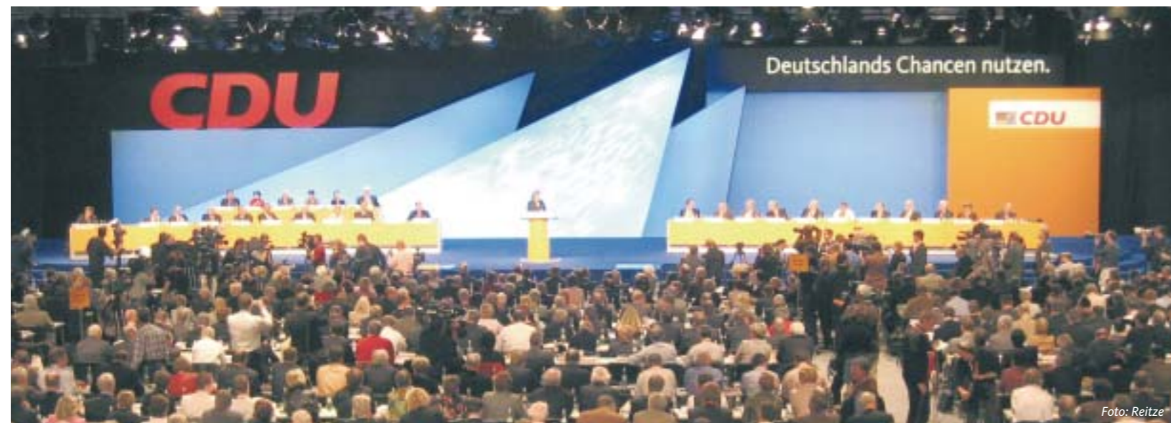
Das Plenum des CDU-Bundesparteitages in Düsseldorf während der Rede der Bundesvorsitzenden Angela Merkel