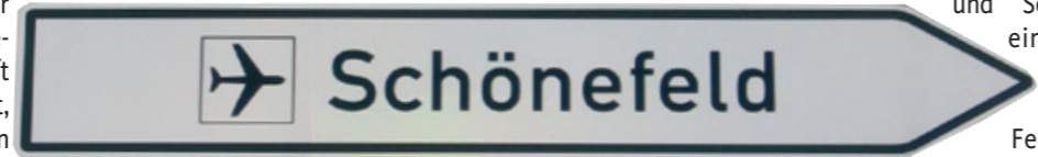
von Hans-Georg Brunnert

Mit diesem Konzept entsteht ein neuer Typus von Flughafen, der die Vorzüge eines Innenstadtterminals mit den vor die Tore der Stadt ausgelagerten, störenden Flugbetriebsanlagen eines Intercontinental Flughafens verbindet. Vorhandene Ressourcen werden so weiter genutzt, neue Baumaßnahmen können reduziert bzw. nach Bedarf später realisiert werden. Eine neue Anbindung von Schönefeld an den Lehrter Bahnhof wird nicht mehr erforderlich. Der Standort Tempelhof ist hervorragend in das städtische, regionale und bundesdeutsche Strassen- und Schienennetz eingebunden. Erst recht nach der Fertigstellung des nahen Bahnhofs Papestraße. Die Erreichbarkeit mit öffentlichen Verkehrsmitteln ist ebenfalls optimal.