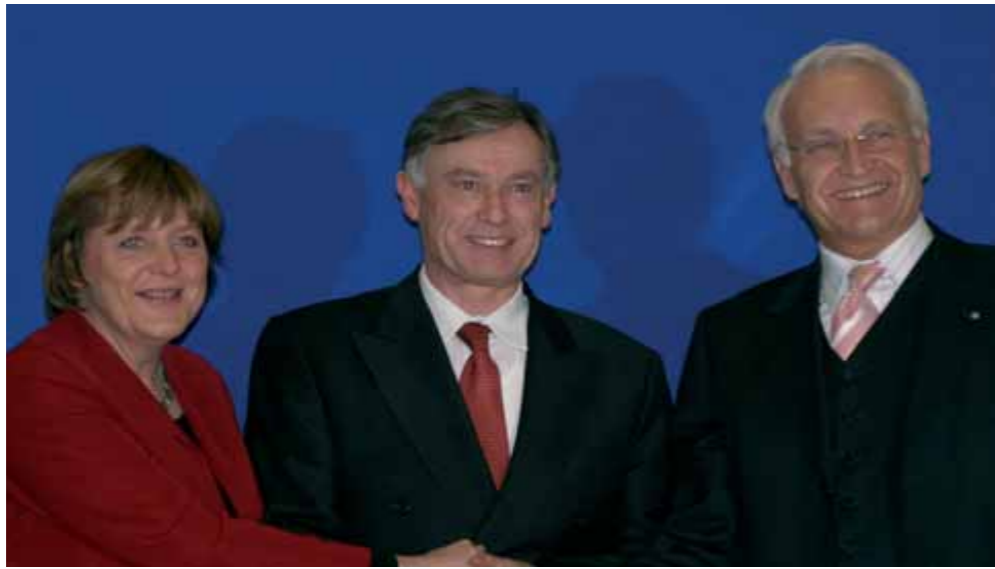
CDU-Vorsitzende Angela Merkel, Horst Köhler, CSU-Vorsitzender Edmund Stoiber (v.l.n.r.)

Wandels in Deutschland ausgehen“. Weiter sagte die Partei- und Fraktionsvorsitzende, der frühere IWF-Chef setzte sich für die soziale Gestaltung der Globalisierung ein, damit „alle Menschen von diesem Prozess profitieren“ könnten. Immer wieder habe Köhler darauf hingewiesen, dass „die Wirtschaft für den Menschen da sein muss und nicht umgekehrt“. Dessen ungeachtet verkörpere der 61-Jährige den Willen zur Veränderung, den Deutschland so dringend benötige, um auch in Zukunft seinen Wohlstand halten zu können. Angela Merkel wörtlich: „Er wird das Ansehen Deutschlands bei unseren Partnern in Europa und der ganzen Welt stärken“.