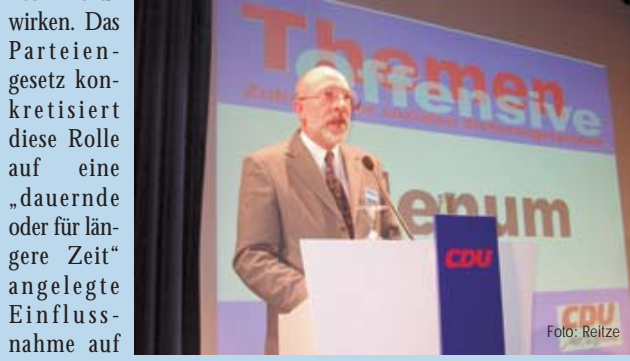
CDU-Generalsekretär Gerhard Lawrenz

Das Grundgesetz der Bundesrepublik Deutschland misst den Parteien die Rolle zu, an der politischen Willensbildung des Volkes mitzuwirken. Das Parteiengesetz konkretisiert diese Rolle auf eine „dauernde oder für längere Zeit“ angelegte Einflussnahme auf die politische Willensbildung.