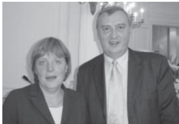
Der Berliner Europaabgeordnete Ingo Schmitt (CDU) mit der Bundesvorsitzenden der CDU Angela Merkel

soll für erforderliche Verfassungsänderungen immer ein Konvent einberufen werden, wenn dies vom Parlament gefordert wird.